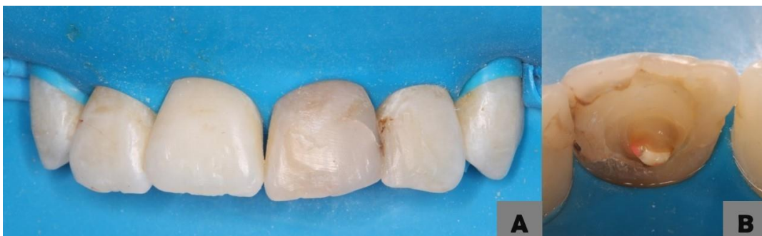
Figura 02- (A) isolamento absoluto; (B) aspecto clínico após acesso do canal radicular

Constatada a normalidade do tratamento endodôntico por análise radiográfica, foi realizado o isolamento absoluto do campo operatório e realizada a remoção da restauração por palatina até o acesso do material obturador (Figura 2).