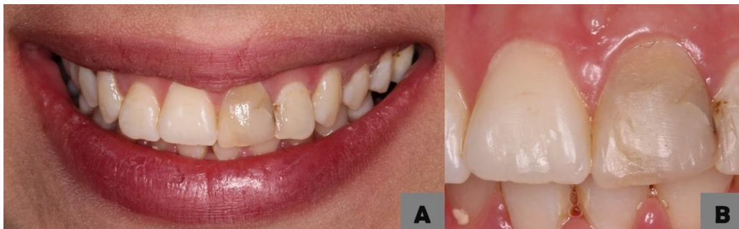
Figura 01- Aspecto clínico inicial. (A) aspecto da dinâmica do sorriso; (B) vista aproximada

Paciente do sexo feminino, 22 anos, compareceu à clínica escola da UNIBRA queixando-se de um dente escurecido após tratamento endodôntico (Figura 1).