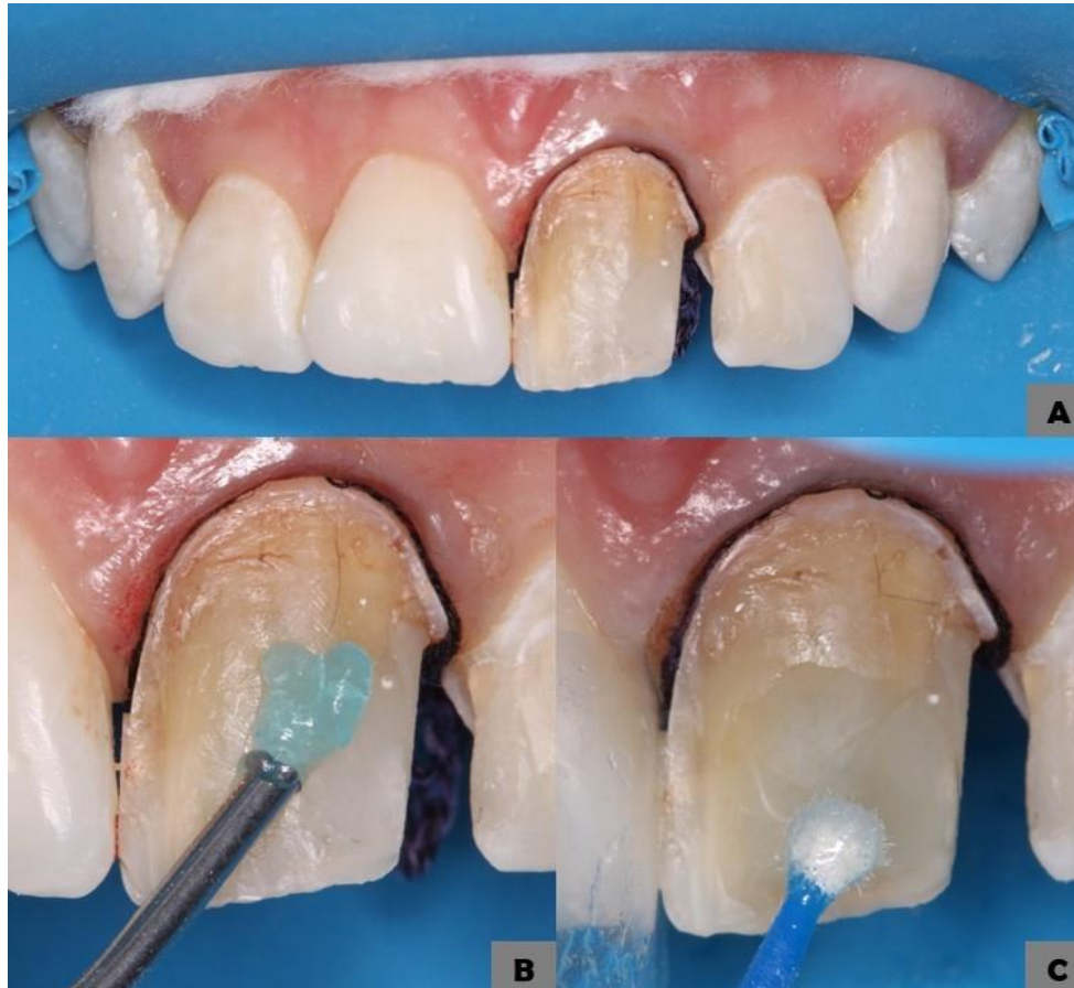
Figura 4- (A) isolamento semi absoluto; (B) condicionamento com ácido fosfórico 37%; (C,D) aplicação do adesivo

profilaxia com pasta de pedra pomes e água, condicionamento com ácido fosfórico 37% por 15 s (dentina), spray de água e ar, secagem, aplicação do adesivo com microbrush e polimerização por 20 s (Figura 4).