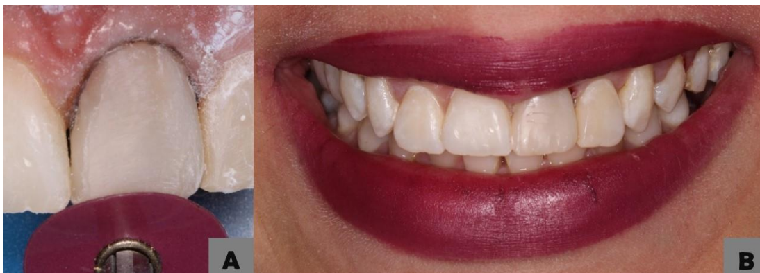
Figura 5- (A) acabamento com disco de lixa; (B) aspecto clínico final

Na sequência foi realizado o facetamento com resina composta (Opallis, FGM, Santa Catarina, Brasil), seguido do acabamento com discos de lixa (Praxis, TDV, Santa Catarina, Brasil). E polimento com discos de feltro (Diamond Flex, FGM, Santa Catarina Brasil (Figura 5).